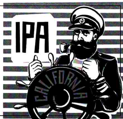
Nhãn chai 500 ml: