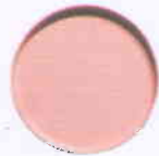
(Kích thước: D x H = 16cm x 1,4 cm)