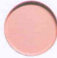
(Kích thước: D x H = 30 cm x 3 cm)