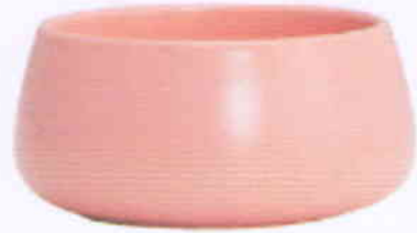
(Kích thước: D 12÷20 cm x H 6÷ 8cm)