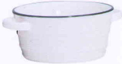
(Kích thước: D = 9cm đến 20cm)