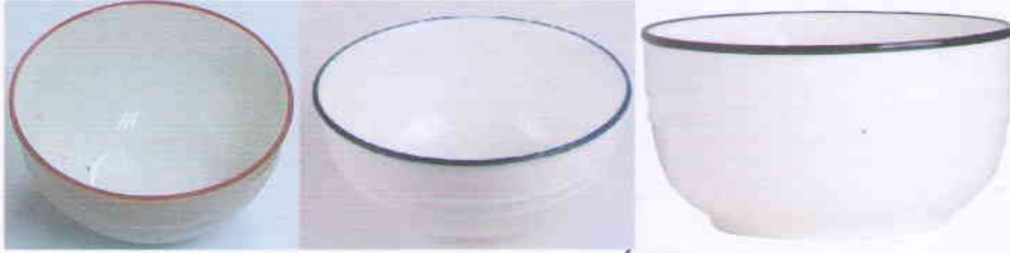
(Kích thước: D = 9cm đến 20cm)