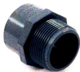
NỐI THẲNG REN NGOÀI D27

Địa chỉ: Tổ 15, P. Kiến Hưng, Q. Hà Đông, Hà Nội Http://cucphuong.com.vn/ Tel: 02438 532 541