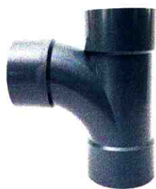
BA CHẠC CONG 88°

CÔNG TY CỔ PHẦN CÚC PHƯƠNG Địa chỉ: Tổ 15, P. Kiến Hưng, Q. Hà Đông, Hà Nội Http://cucphuong.com.vn/ Tel: 02438 532 541