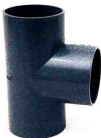
BA CHẠC 90°

CÔNG TY CỔ PHẦN CÚC PHƯƠNG Địa chỉ: Tổ 15, P. Kiến Hưng, Q. Hà Đông, Hà Nội Http://cucphuong.com.vn/ Tel: 02438 532 541