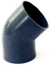
NỐI GÓC 45° D27