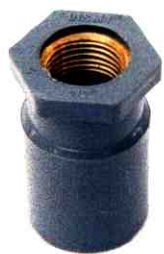
NỐI THẲNG REN TRONG ĐỒNG D27