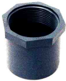
NỐI THẲNG REN TRONG D27