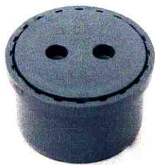
BỊT XẢ THÔNG TẮC D27

CÔNG TY CỔ PHẦN CÚC PHƯƠNG Địa chỉ: Tổ 15, P. Kiến Hưng, Q. Hà Đông, Hà Nội Http://cucphuong.com.vn/ Tel: 02438 532 541