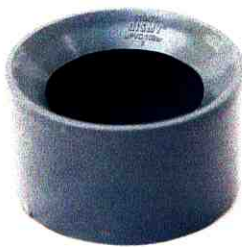
BẠC CHUYỂN BẠC D27

CÔNG TY CỔ PHẦN CÚC PHƯƠNG Địa chỉ: Tổ 15, P. Kiến Hưng, Q. Hà Đông, Hà Nội Http://cucphuong.com.vn/ Tel: 02438 532 541