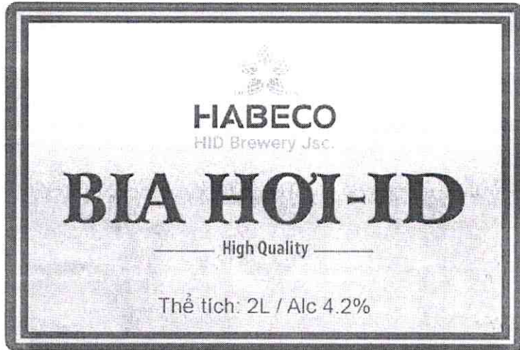
M. Trước - KT: 8 x 12 cm