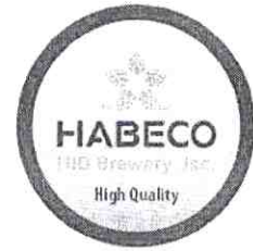
KT: 3.6 x 3.6 cm