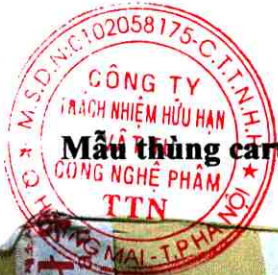
Mẫu thùng carton cũ