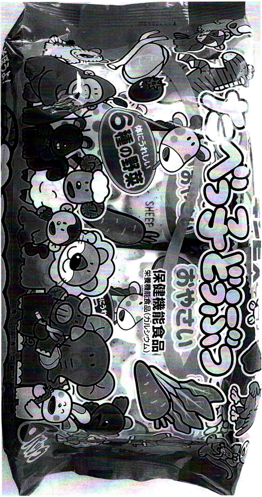
Scanned with CamScanner