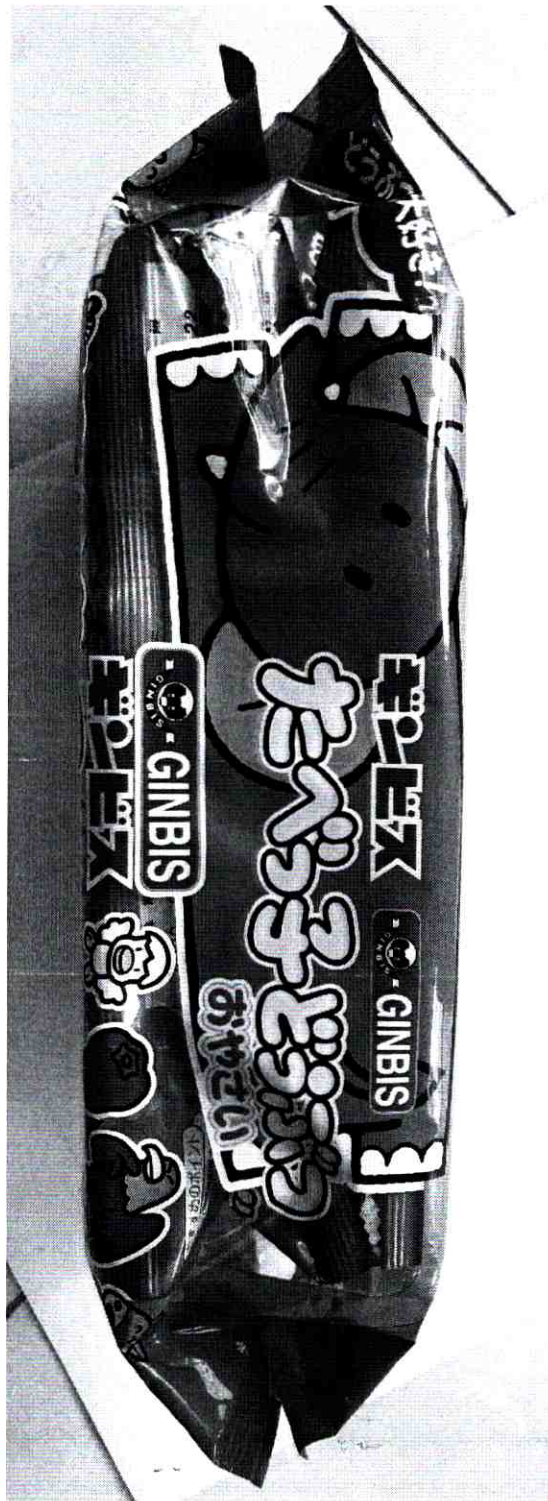
Scanned with CamScanner