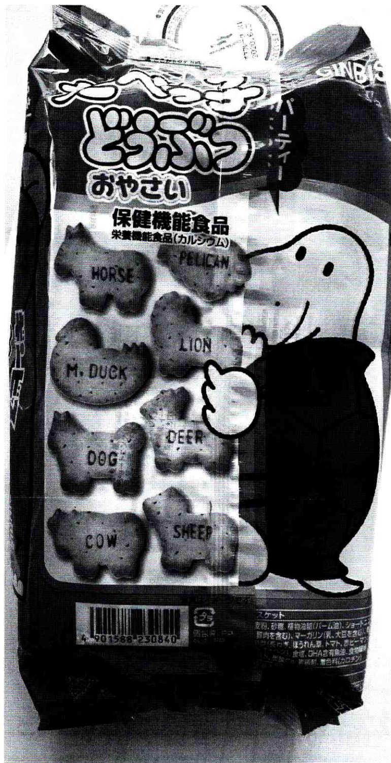
Scanned with CamScanner