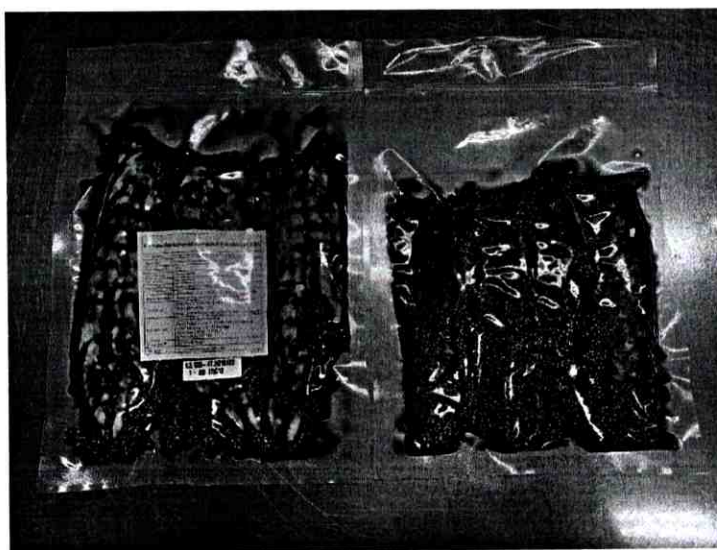
Hình gói hàng