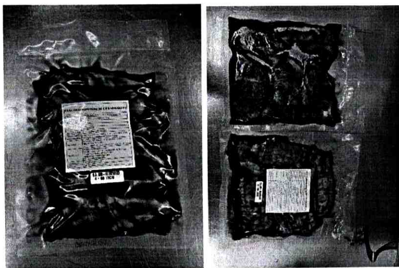
Hình gói hàng