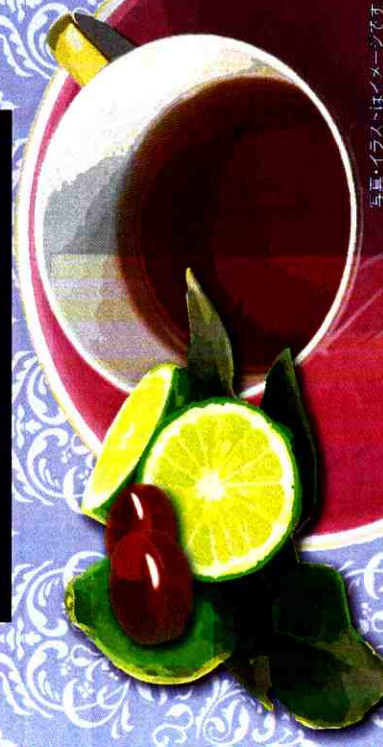
写真・イラストはイメージです

KEO HOÀNG GIA 紅茶キャンディ EARL GREY Sự kết hợp hài hòa giữa trà đen chất lượng cao và tinh dầu từ vỏ cam Bergamot tạo nên hương vị đặc đáo cho kẹo Hoàng Gia Earl Grey