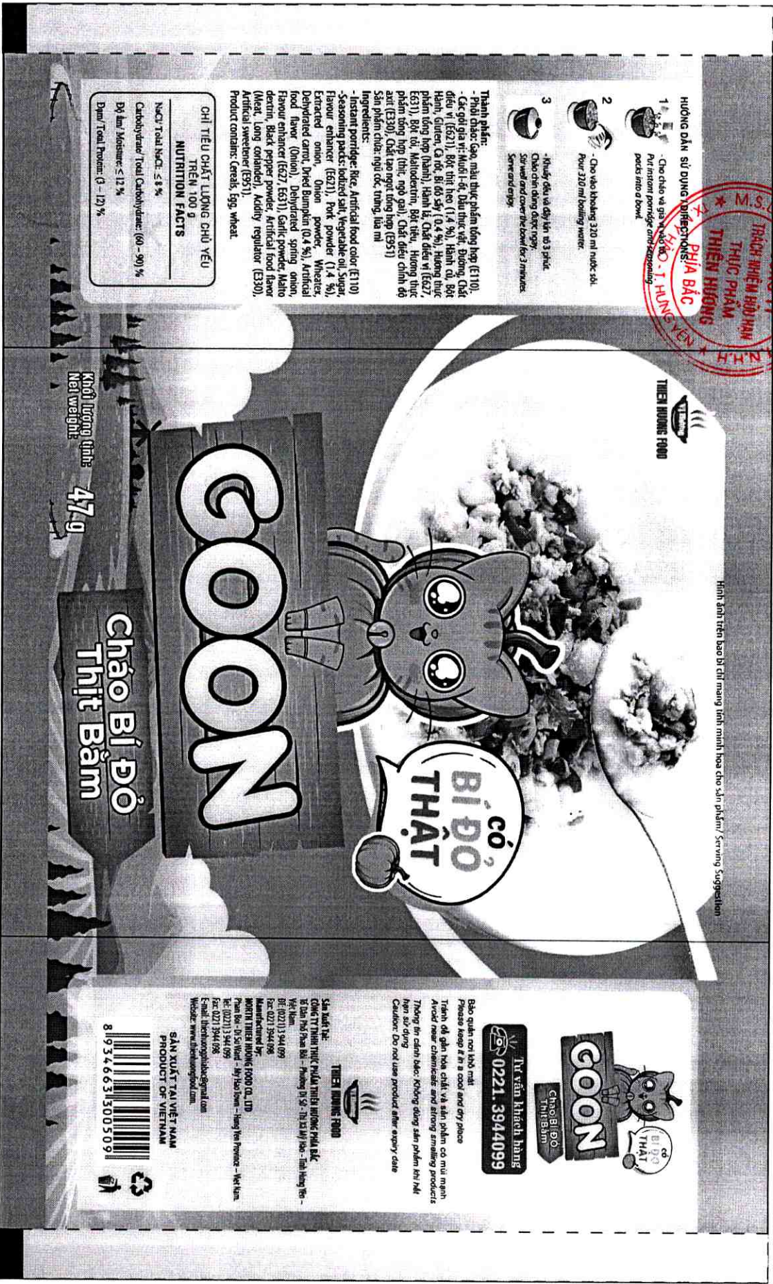
Hình ảnh trên bao bì chỉ mang tính minh họa cho sản phẩm/ Serving Suggestion