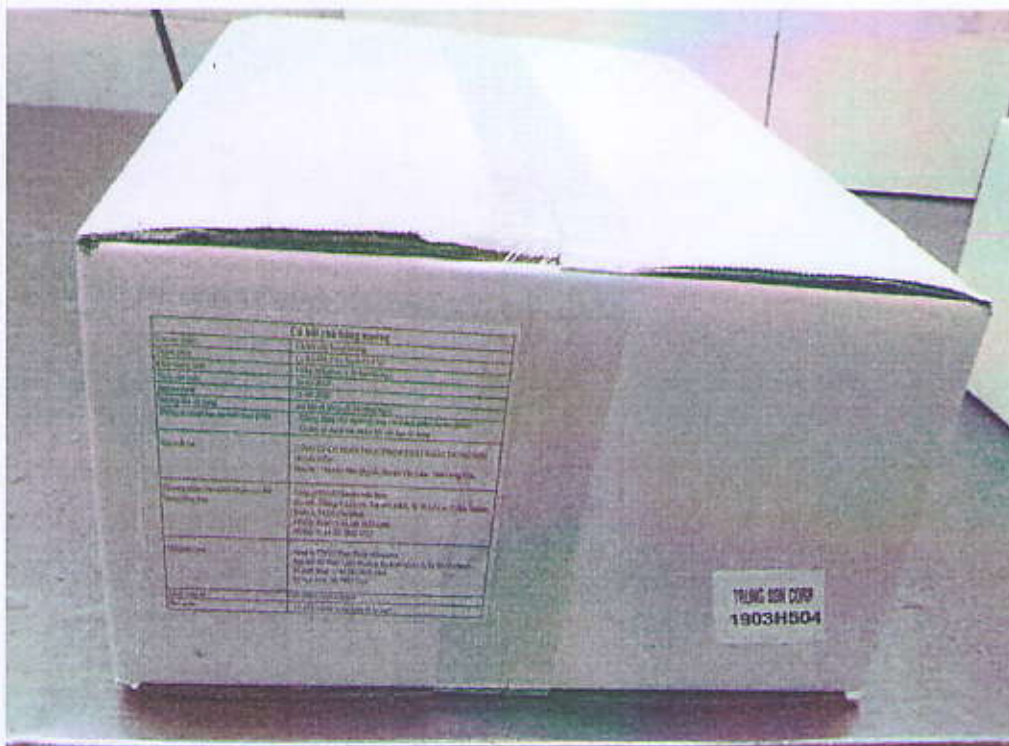
Hình thùng thành phẩm