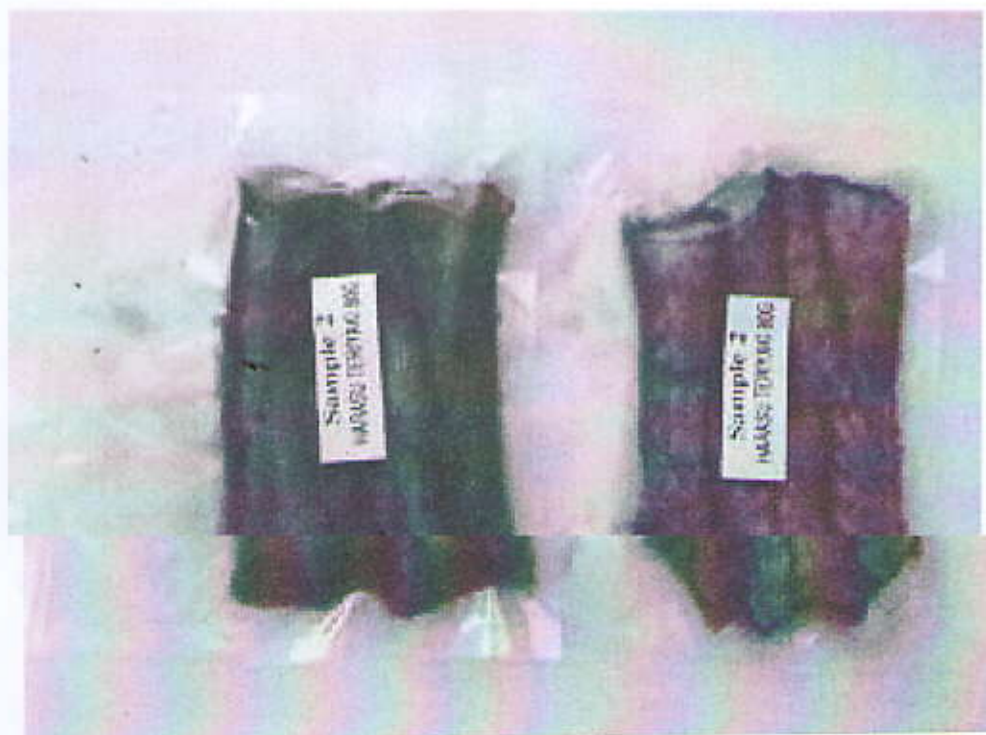
Hình gói hàng