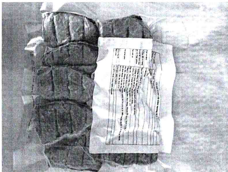
Hình gói hàng