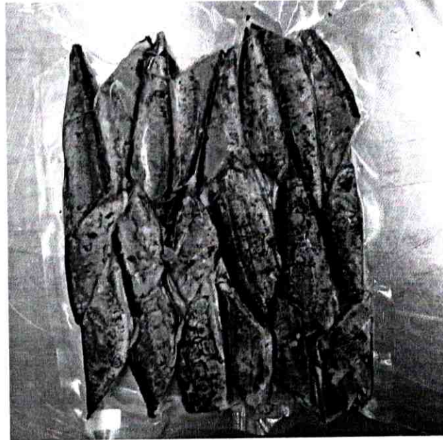
Hình gói hàng