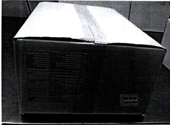
Hình thùng thành phẩm